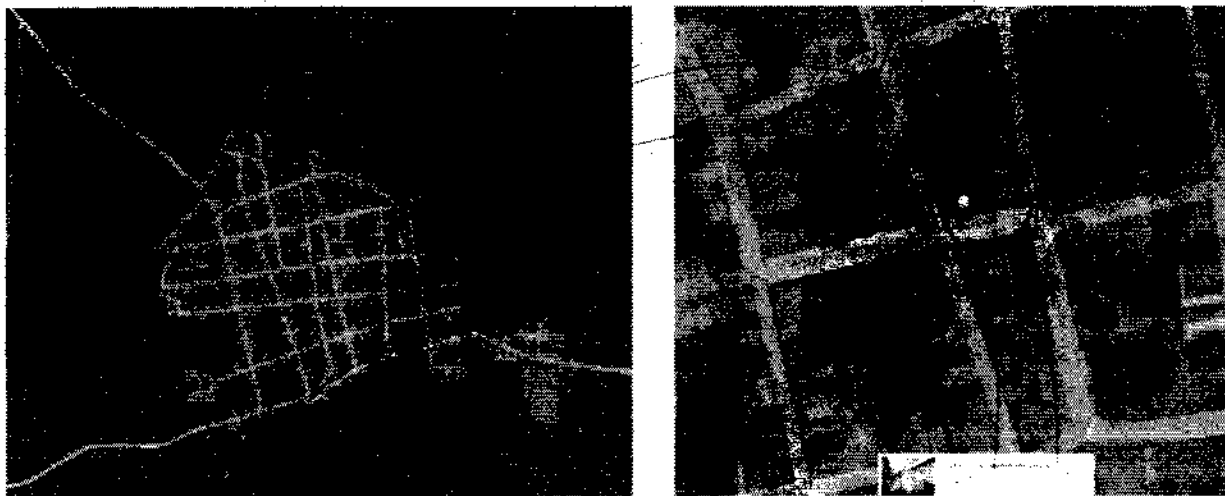
IMAGEN 1. ubicación del proyecto.

El documento aportado consta de lo siguiente: