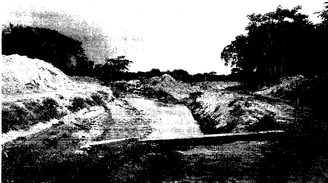
Pontón que debe ser objeto de protección

Se observó también que los trabajos podrán poner en riesgo estructural algunos Box y/o pontones que construidos con anterioridad sobre el cauce de esta quebrada. Razón por la cual se hace necesario que se adelante la construcción de estructuras de protección de estas obras hidráulica. A continuación se muestra una de estas estructuras que podrían estar en riesgo su estabilidad.