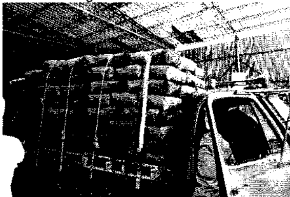
Fotografía No. 4. Vehículo encontrado listo para ser despachado con Cemento

Vehículo listo para despachar producto terminado (cemento empacado en bolsas de 50 kilos cada una). Se encontró el vehículo marca Dodge, de placas RDE-879, con una carga aproximada de 200 bolsas de cemento, lo que corresponde a una carga de 10 toneladas aprox. Este vehículo se muestra en la Fotografías No. 4.