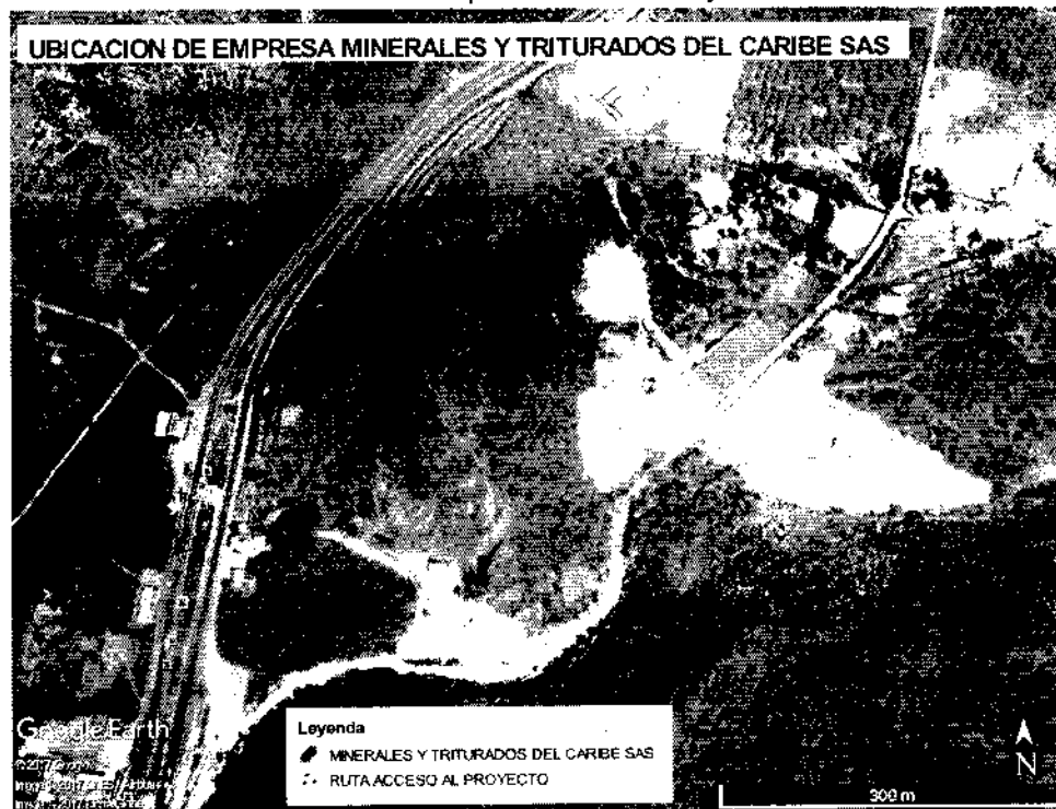
FIGURA No. 1. Ubicación de la Empresa Minerales y Triturados del Caribe SAS