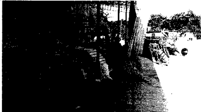
Fotografía No. 2. Yeso encontrado en la Planta de la Empresa