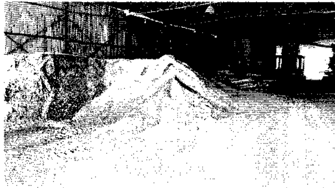
Fotografía No. 1. Clinker encontrado en la Planta de la Empresa