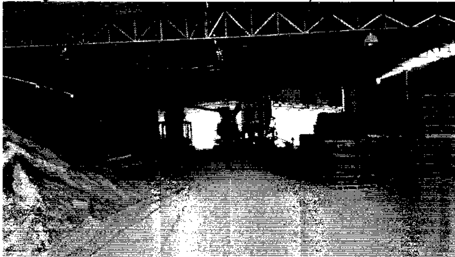
Fotografía No. 5. Cemento almacenado listo para ser despachado