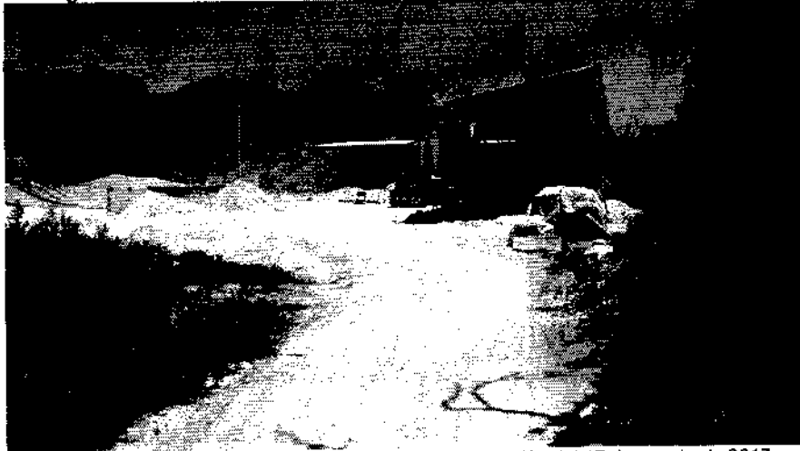
Fotografía No. 6. Producción de Carbonato de Calcio y Marmolina