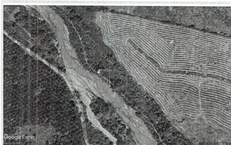
Figura 3. Trincho a lo largo y ancho del río Fundación en inmediaciones de la finca Matacumbre. Coordenadas geográficas 10°38'40.4"N - 74°24'08.1"O