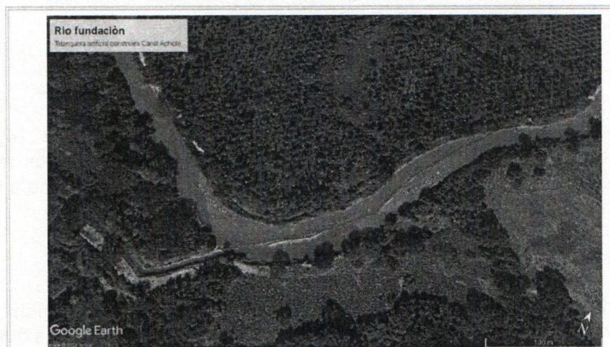
Figura 2. Trincho a lo largo y ancho del río Fundación en la bocatoma Los Achiotes (Elaboración propia. Google Earth). Coordenadas geográficas 10^{\circ}37'13.136''N - 74^{\circ}18'45.672''O

B.) En el punto de coordenadas geográficas 10^{\circ}37'13.136''N - 74^{\circ}18'45.672''O , se pudo evidenciar presuntamente la construcción de otro trincho artificial, construido con material sedimentado del mismo río, puntales de madera y sacos de arena, con la intención de desviar la mayor cantidad de agua del río Fundación a través la bocatoma Achiote hacia el canal artificial los Achiote, atravesando este cauce. El trincho tiene una longitud de unos 315 metros aproximadamente. (Ver figura 2). Además en las coordenadas 10^{\circ}37'18.15''N - 74^{\circ}19'13.54''O se evidencio una captación ilegal del río fundación a través de una motobomba Diésel, con una tubería de aproximadamente 12” que conduce el agua hacia un canal interno en la finca perteneciente a la empresa INVERSORA DEL MAGDALENA Y CIA S.A.