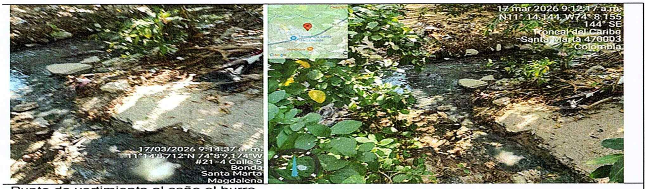
Punto de vertimiento al caño el burro

Durante la diligencia, se constató que el establecimiento no cuenta con los permisos ambientales requeridos para su operación.