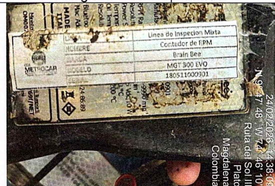
Fotografía 6: serial cuentarrevoluciones – línea mixta.