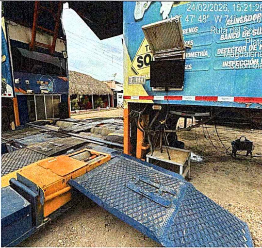
Fotografía 11: área de prueba de frenos y sonido.

“POR MEDIO DE LA CUAL SE EXPIDE UNA CERTIFICACION EN MATERIA DE REVISIÓN DE GASES A UN CENTRO DE DIAGNOSTICO AUTOMOTOR Y SE DICTAN OTRAS DISPOSICIONES”