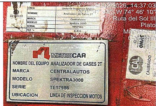
Fotografía 2: serial analizador de gases - 2T.