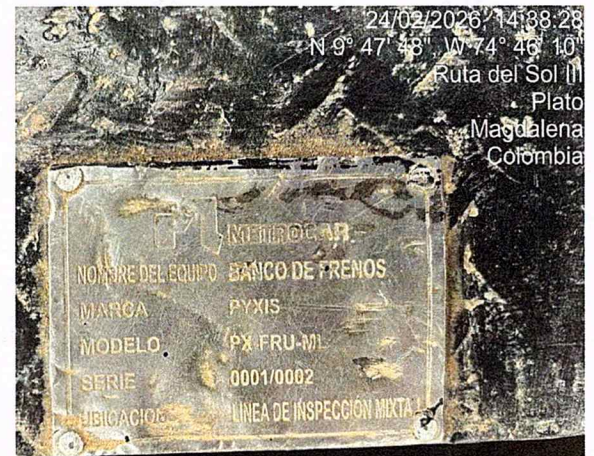
Fotografía 10: serial banco de frenos.