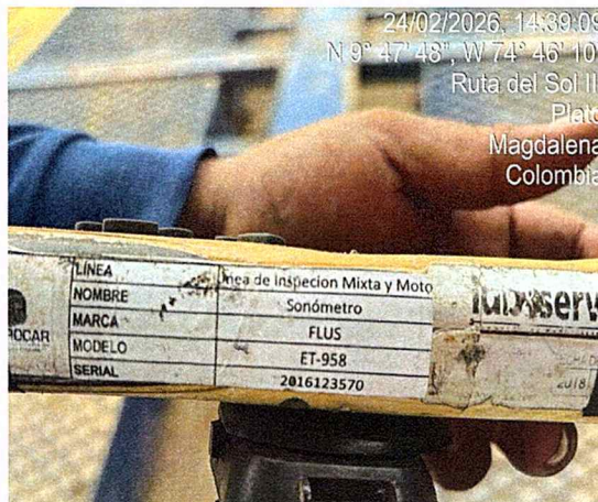
Fotografía 9: serial sonómetro.