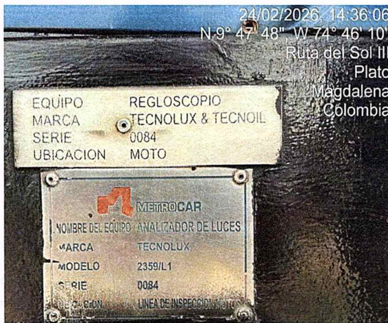
Fotografía 7: serial analizador de luces – línea motos.

“POR MEDIO DE LA CUAL SE EXPIDE UNA CERTIFICACION EN MATERIA DE REVISION DE GASES A UN CENTRO DE DIAGNOSTICO AUTOMOTOR Y SE DICTAN OTRAS DISPOSICIONES”