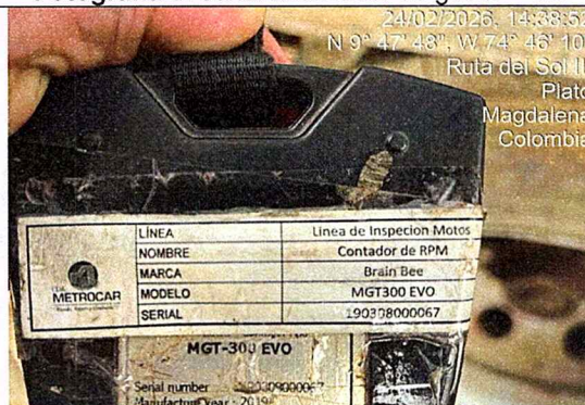
Fotografía 5: serial cuentarrevoluciones – línea motos.