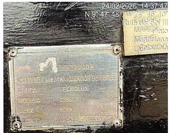
Fotografía 8: serial analizador de luces – línea mixta.