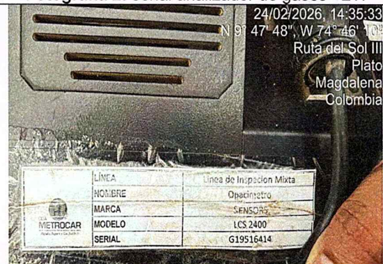
Fotografía 4: serial opacimetro.