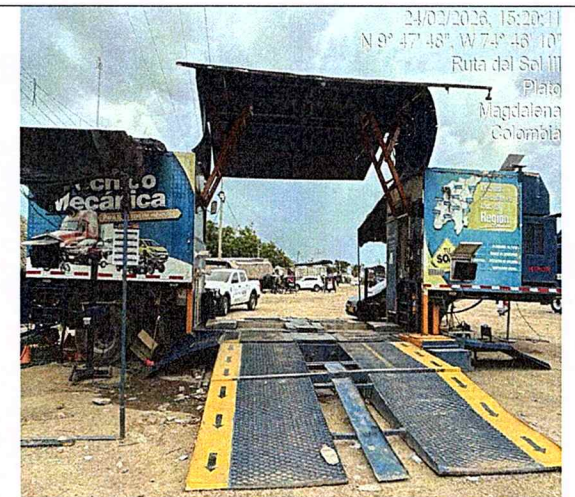
Fotografía 14: panorámica unidad móvil.