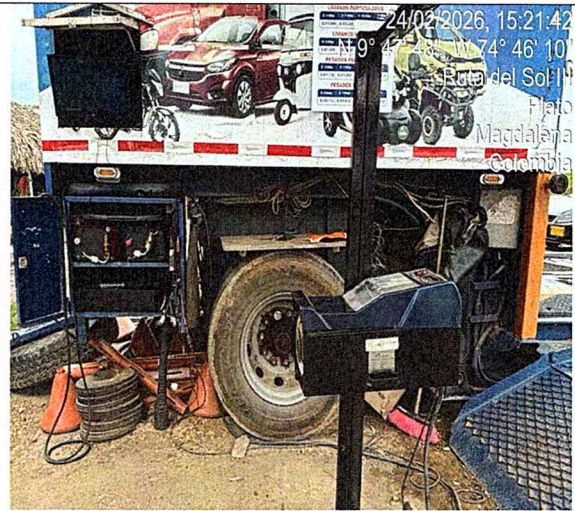
Fotografía 12: área revisión - línea motos.