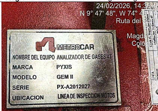
Fotografía 3: serial analizador de gases - 4T.