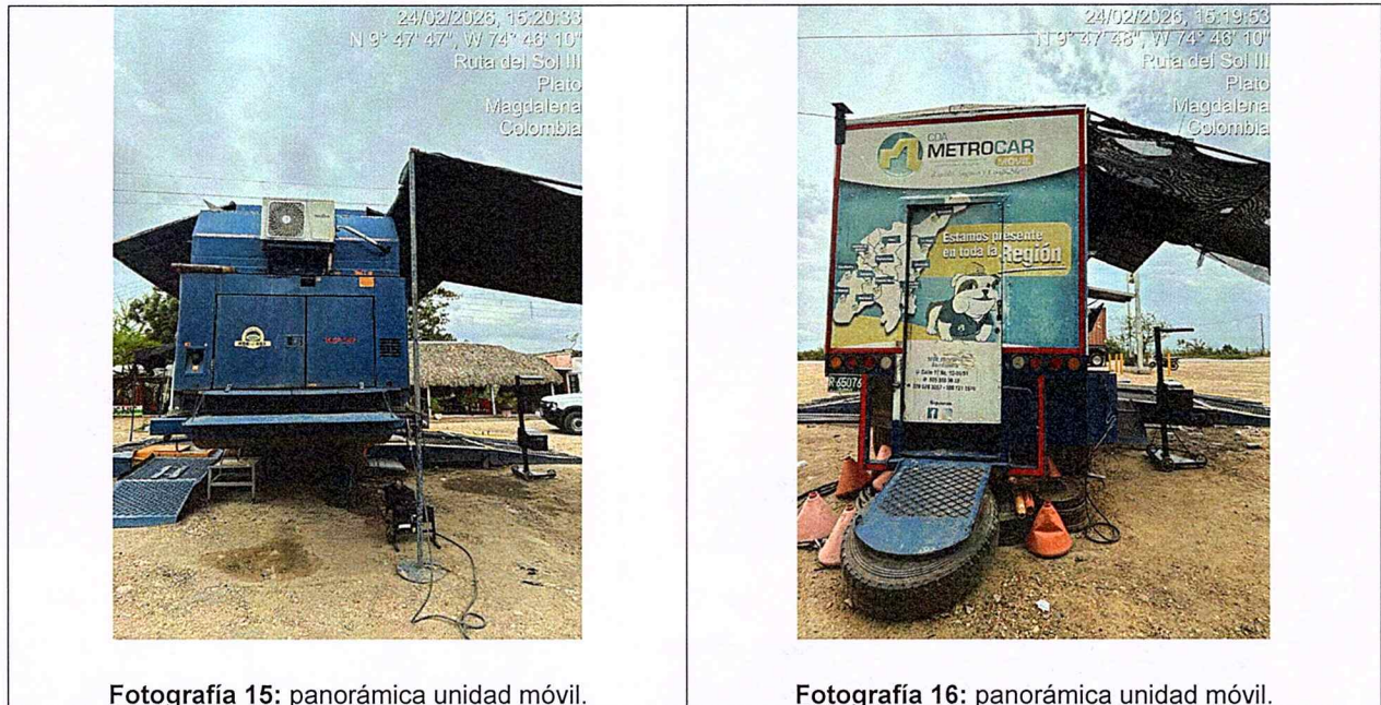
Fotografía 15: panorámica unidad móvil.

“POR MEDIO DE LA CUAL SE EXPIDE UNA CERTIFICACION EN MATERIA DE REVISIÓN DE GASES A UN CENTRO DE DIAGNOSTICO AUTOMOTOR Y SE DICTAN OTRAS DISPOSICIONES”