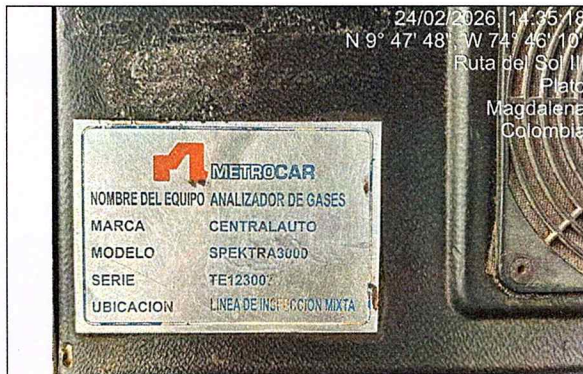
Fotografía 1: serial analizador de gases - gasolina.

“POR MEDIO DE LA CUAL SE EXPIDE UNA CERTIFICACION EN MATERIA DE REVISIÓN DE GASES A UN CENTRO DE DIAGNOSTICO AUTOMOTOR Y SE DICTAN OTRAS DISPOSICIONES”