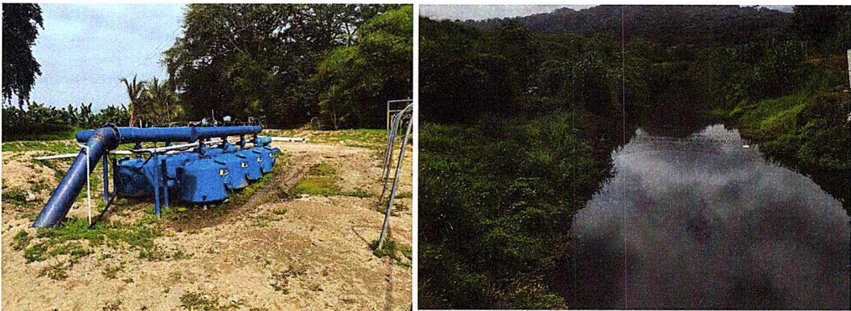
Imagen 2. Estación de bombeo y reservorio

“POR MEDIO DE LA CUAL SE OTORGA UNA RENOVACIÓN DE UNA CONCESIÓN DE AGUAS SUPERFICIALES PROVENIENTES DEL RÍO GUACHACA A FAVOR DE LA EMPRESA FRUTERA DE SANTA MARTA S. A.-FRUTESA S. A. CON NIT N°800.094.791-2 EN BENEFICIO DEL PREDIO LOS CABALLOS I y II, LOCALIZADOS EN EL CORREGIMIENTO DE GUACHACA, DISTRITO DE SANTA MARTA”