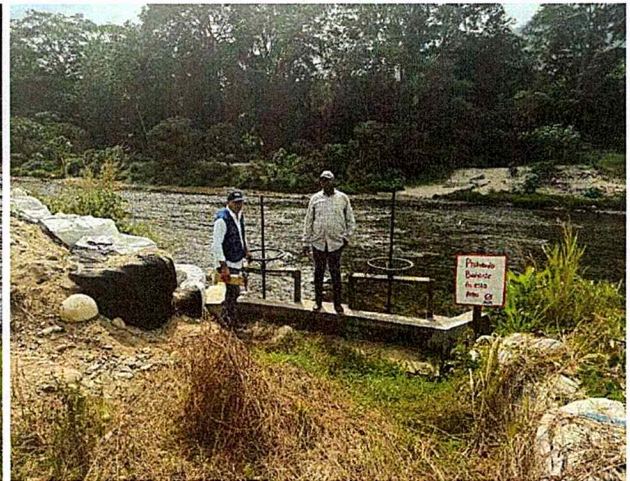
Imagen 1. Captación superficial (Río Guachaca)

Sistema de Conducción: El agua captada y almacenada es impulsada a través de una estación de bombeo, desde donde se distribuye mediante un sistema de canales primarios y secundarios, diseñados para la conducción y entrega del recurso hídrico con fines de riego en la plantación.