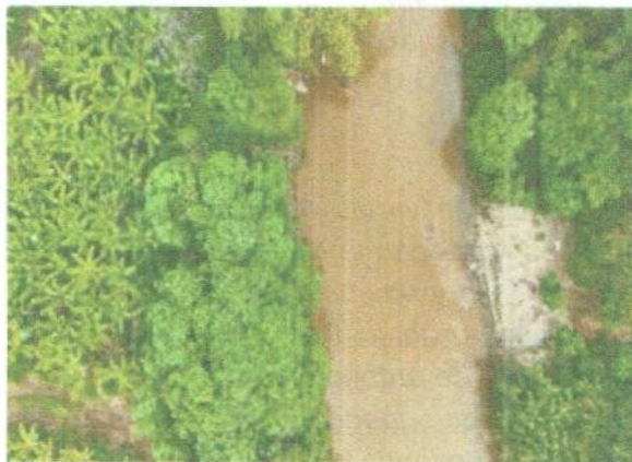
Trincho Predios MRS – Arenal