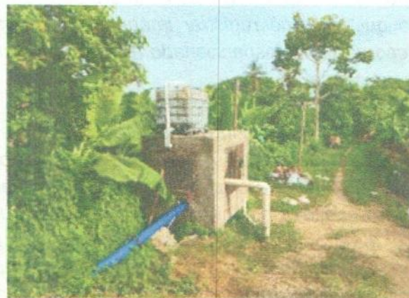
Captación Sector El Mamón