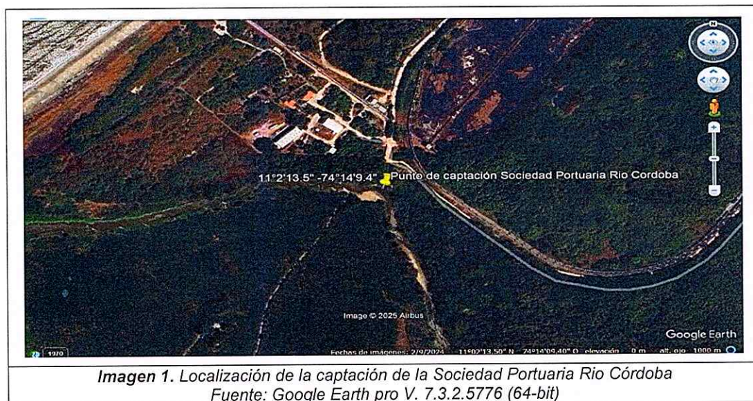
Imagen 1. Localización de la captación de la Sociedad Portuaria Río Córdoba Fuente: Google Earth pro V. 7.3.2.5776 (64-bit)

Las instalaciones del puerto carbonífero se encuentran en la jurisdicción del municipio de Ciénaga, en un lote de terreno de 45 hectáreas sobre la margen derecha del Río Córdoba en su desembocadura al Mar Caribe. El acceso hasta el área portuaria se hace a través de una carretera ramal de 3.5 km de longitud aproximadamente, que se deriva en el kilómetro 64 margen izquierda de la carretera Barranquilla - Santa Marta.