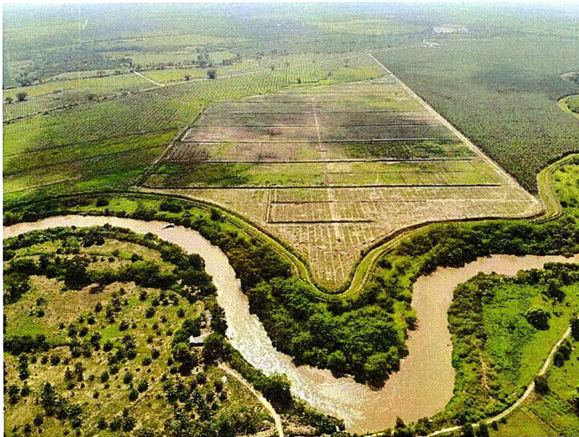
Foto 1. Vista panorámica del río Fundación

Los trabajadores presentes en el predio manifestaron que no se ha implementado infraestructura para riego desde la expedición de la concesión y que actualmente no se realiza captación de aguas superficiales del río Fundación.